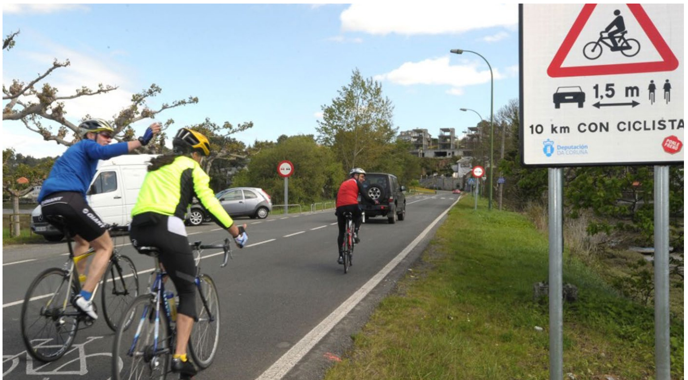
Imagen de una carretera compartida entre ciclistas, autos y señalizaciones

La Autoridad del Tránsito y Transporte Terrestre cuenta con la Dirección Nacional de Educación Vial y Defensa del Usuario que tiene como objetivo alentar la creación de alianzas multisectoriales con instituciones públicas y privadas con la capacidad de elaborar estrategias, planes y metas nacionales sobre seguridad vial, Panamá en Bici colabora directamente con esta dirección de la mano de la Embajada Holandesa de Ciclismo.