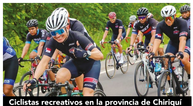
Ciclistas recreativos en la provincia de Chiriquí