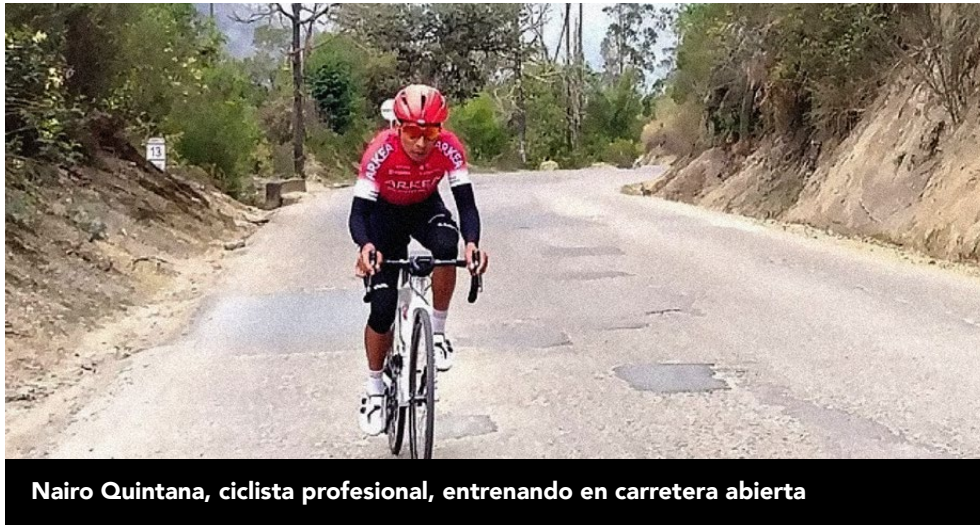
Nairo Quintana, ciclista profesional, entrenando en carretera abierta

Adicional al reglamento de tránsito, existe la ley 74 de 2017 sobre movilidad de ciclismo en la República de Panamá y actualmente, se suma el decreto ejecutivo 206 del 30 de abril de 2021 que entre otras cosas establece lo siguiente: