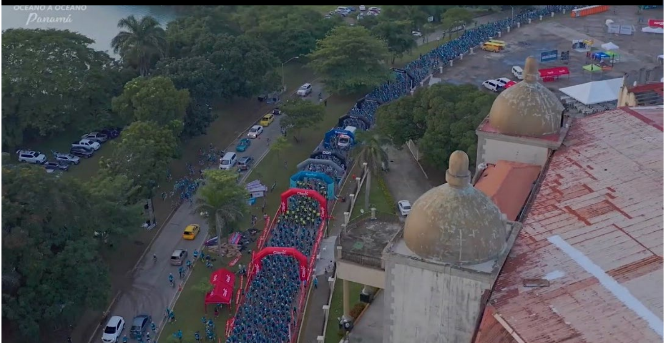
Gran Fondo Océano a Océano Panamá, punto de partida Centro de Convenciones Amador

Pero los turistas no solo viajan a los distintos países cuando existen este tipo de eventos, al crearse esta cultura de ciclismo como turismo, desde hace ya varios años, los amantes de este deporte, viajan por todo el mundo, para conocer nuevas rutas desde su bicicleta y apreciar los paisajes más impresionantes de cada país, compartiendo las calles con los autos, tal y como cada país lo promueve en sus leyes, dentro de las más relevantes, esta la ley que reglamenta el 1,5 metros de distancia que debe tener el auto al rebasar al ciclista.