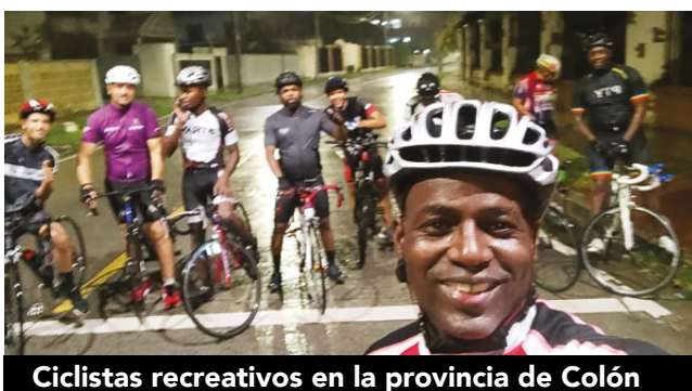
Ciclistas recreativos en la provincia de Colón

Tal es el caso del evento Gran Fondo Océano a Océano Panamá, donde participan más de 7,000 personas de 28 países distintos, siendo el evento más grande de ciclismo recreativo en Latinoamérica y entre los más grandes del mundo.