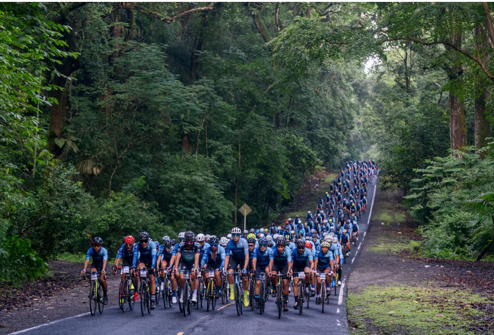
Participantes del Gran Fondo Océano a Océano recorriendo la Forestal